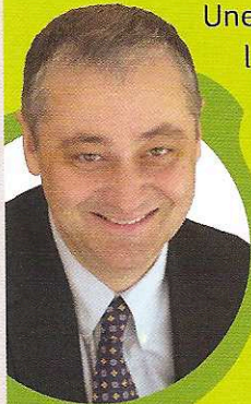
PHILIPPE BLOCH, Fondateur de Columbus Café et auteur de « Service Compris 2.0 »

Une démarche dans laquelle les outils actuels de marketing et de communication peuvent les accompagner de manière fortement qualitative.”